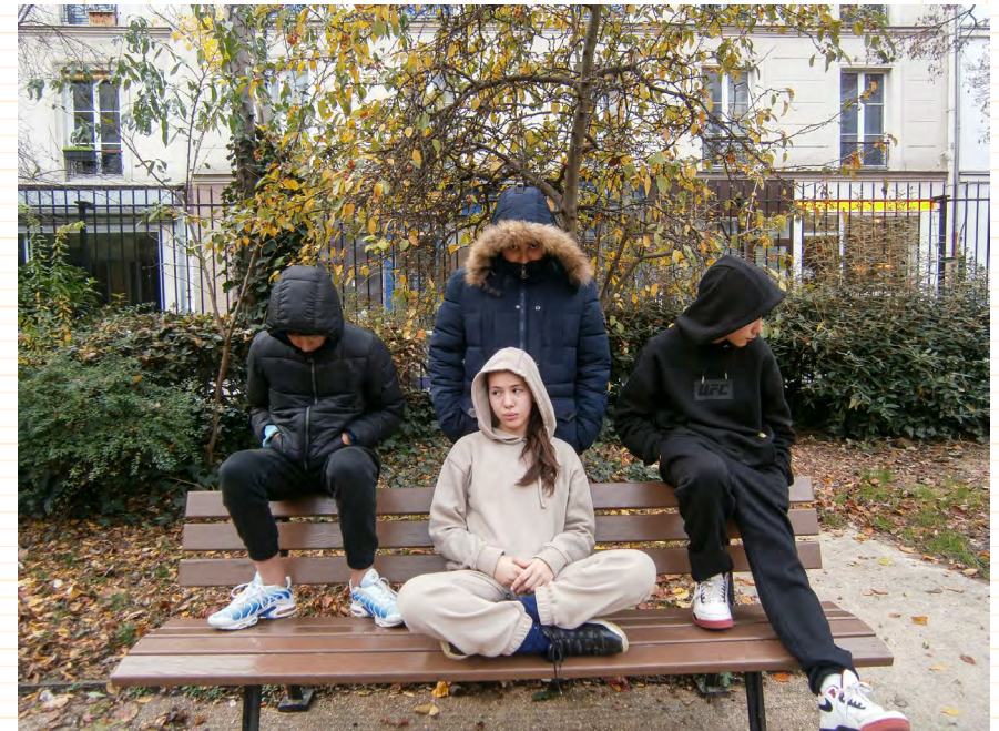
Photographies mises en scène avec les collégiens en s'inspirant du travail de Mohamed Bourouissa et Randa Maroufi