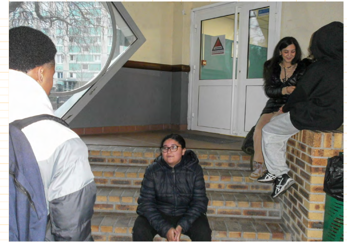
Photographies mises en scène avec les premières animation en s'inspirant du travail de Mohamed Bourouissa et Randa Maroufi

Nous poursuivons la séance par la préparation de la prise de vue qui s'avère plus fastidieuse qu'avec les autres groupes, notamment en raison des mauvaises conditions météo et de la lumière peu présente. Malgré ce contexte difficile, les élèves produisent quelques mises en scène pertinentes. Il s'agit de la dernière séance avec les compacts ; au prochain atelier, nous travaillerons en studio avec mon reflex numérique.